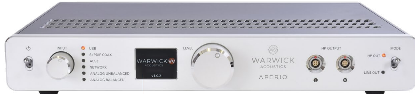
全新的 高分辨率彩色液晶显示屏