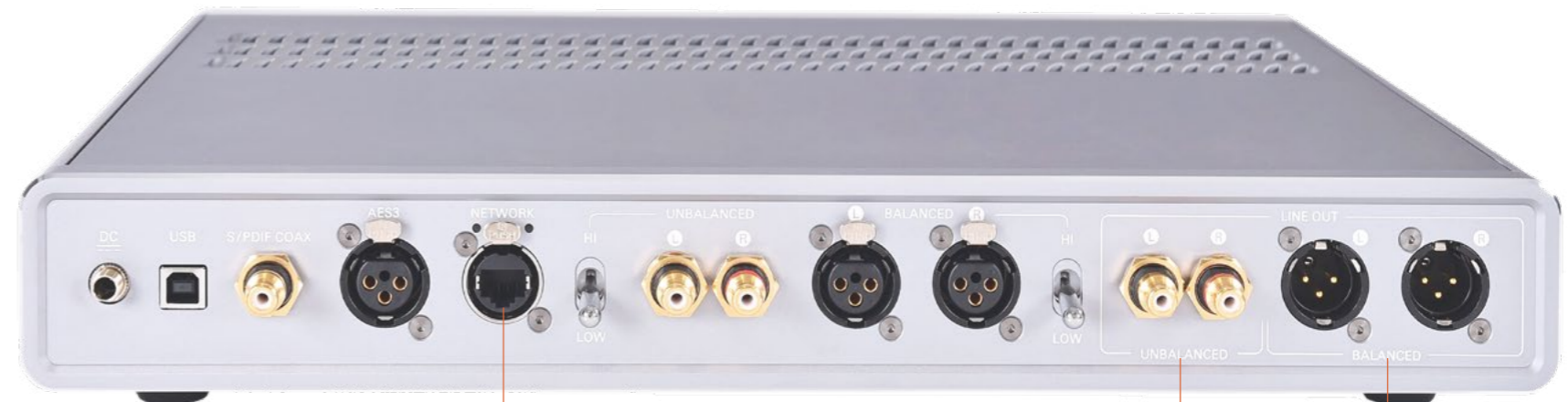
全新的 可联网功能，超越了传统的 DLNA 限制

APERIO 可以通过 USB 信号源输入接口进行固件更新，在任何基于 Windows/MAC/Linux 操作系统的主机上都可以使用一个简单的应用程序进行操作。此功能允许用户在产品的生命周期内保持 APERIO 至最新状态。